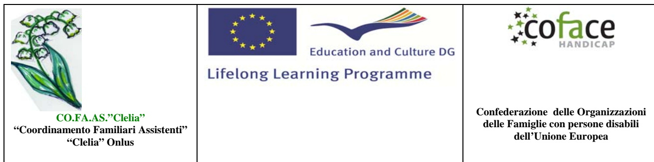
TAVOLA ROTONDA SUI FAMILIARI ASSISTENTI